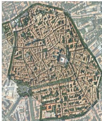
Périmètre du Secteur Sauvegardé d'Aix-en-Provence