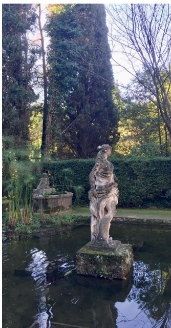
Serre de la Madone, Menton