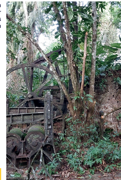
Habitation Vidal-Mondelice, Guyane