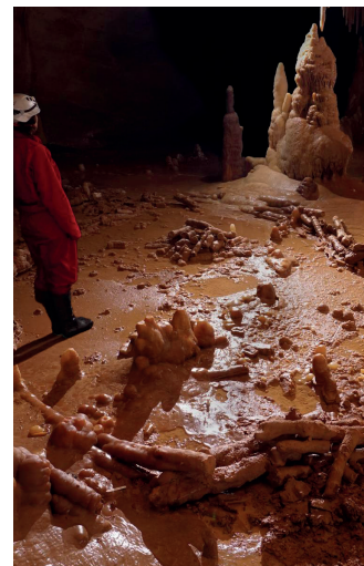
Grotte de Bruniquel construite par l'Homme de Néandertal, -175 000 ans